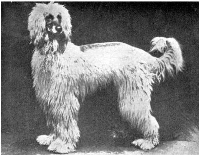
Rotumääritelmän laadinnassa ihanteena pidetty Zardin, tuotu Englantiin 1907.

Myöhempään alkuperämaatuonteihin perustuvilla koirakannoilla on laadittu omat rotumääritelmät kahdessa maassa. Sveitsin kennelliitto on vahvistanut rotumääritelmän rotukirjan liitteeseen otetulle Khalag tazi –muunnokselle ja Venäjällä on oma rotumääritelmä aboriginaali-afgaanille. Kumpikaan ei kuitenkaan ole FCI:n tunnustama rotu.